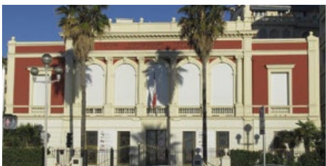
Centre Universitaire Méditerranéen 65 Promenade des Anglais