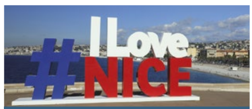
#IloveNice memorial - Quai Rauba Capeu