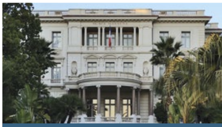
Villa Massena - 85 rue de France